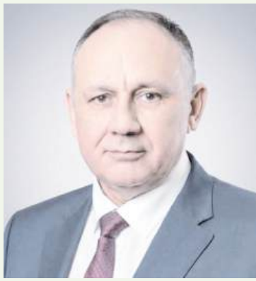
Глава города Ханты-Мансийска Максим Ряшин:

– Поздравляю личный состав Управления Росгвардии по Югре с 10-летием со дня образования Федеральной службы войск национальной гвардии Российской Федерации и 215-й годовщиной создания войск правопорядка! История